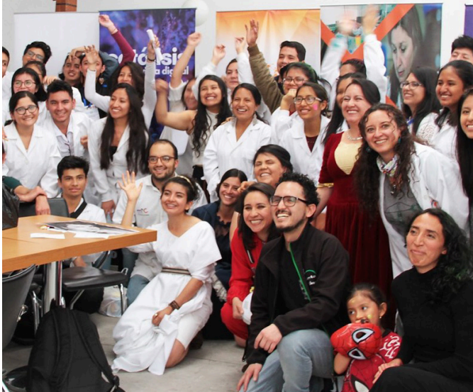
" Súper científicas que no conocías " fue un evento que se llevó a cabo en el Museo Interactivo de Ciencias, como una acción para destacar la labor de estas especialistas