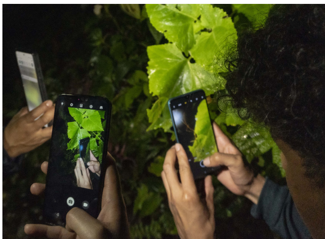
El Desafío Naturaleza Urbana es una instancia oportuna para promover la divulgación científica de una forma efectiva.

En cuanto al aporte de la divulgación científica a la Educación Ambiental, se señaló que proporciona información amigable y directa. Se reafirmó la necesidad de anclar la divulgación científica a temas de Educación Ambiental, ya que está relacionada directamente con la investigación científica y genera datos relevantes que deben ser divulgados a gran escala por su importancia frente a problemáticas sociales actuales.