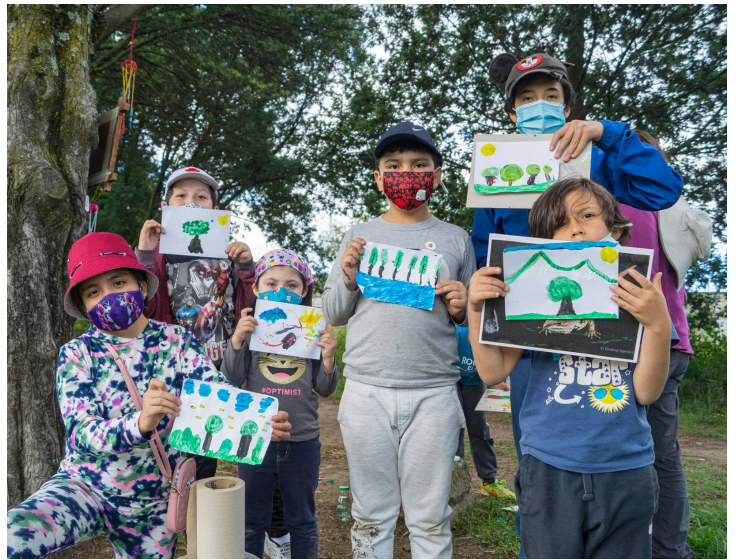
Niñas y niños participantes de la Ruta del Árbol, un encuentro ciudadano fomentado por el Zoológico de Quito, muestran sus creaciones inspiradas en el bosque urbano del parque Bicentenario.

Se planteó que varias iniciativas de divulgación científica no han sido sistematizadas ni difundidas porque los esfuerzos individuales responden únicamente a requisitos de proyectos y programas financiados por la cooperación internacional.