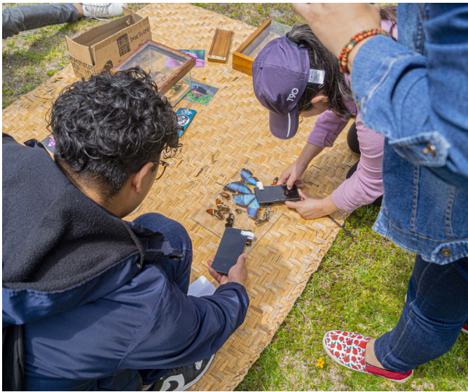
El uso del microcosmos promovido por la Red Divulgaciencia es una herramienta muy útil para las actividades de vinculación de la comunidad con la educación ambiental.