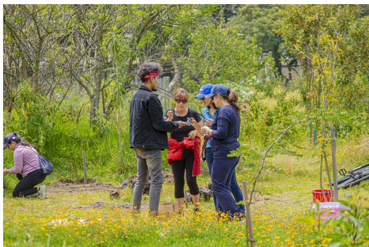
El acompañamiento de educadores en la experiencia refuerza el objetivo de que cada visitante establezca un vínculo desde el aprendizaje y la reflexión

Ante la pregunta de cómo pueden vincularse el zoológico, el jardín botánico y los museos a las escuelas de una manera más práctica, con proyectos de largo alcance, se comentó que «la Educación Ambiental tiene un papel indispensable en zoológicos, jardines botánicos y museos ya que son espacios experienciales donde la educación se entiende con su entorno». De esta manera se permite que las personas se acerquen a información que parece difícil de entender y se rompen barreras.