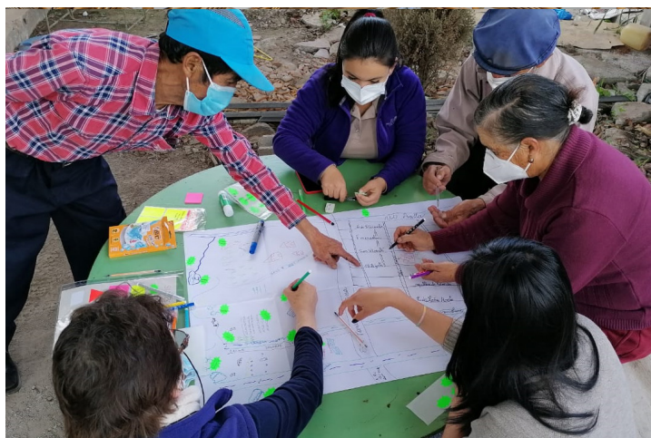
La comunidad de Iguñaro participó activamente en fases de diagnóstico respecto a su valoración y conocimiento de los entornos naturales donde habitan.

En cuanto a los procesos de evaluación, se mencionó que el problema radica principalmente en que los proyectos de Educación Ambiental no realizan ni monitoreo ni evaluación. Se explicó que los monitoreos son necesarios porque posibilitan verificar indicadores planteados y replantearlos acorde a lo que requiere el proyecto. «Permiten un seguimiento continuo para conocer si existe la respuesta que queremos y así cambiar el proceso planteado en caso de ser necesario», se comentó. Se recordó que tanto la evaluación como el monitoreo se deben considerar desde la planificación porque la evaluación mide todo el proceso: desde el inicio hasta el final con relación a un objetivo. En los sistemas de evaluación son esenciales los objetivos ya que estos señalan el alcance y las metas a plantearse. Se reconoció que en los proyectos de Educación Ambiental falta claridad en los objetivos y su alcance, así como establecer indicadores y metas acordes al proceso.