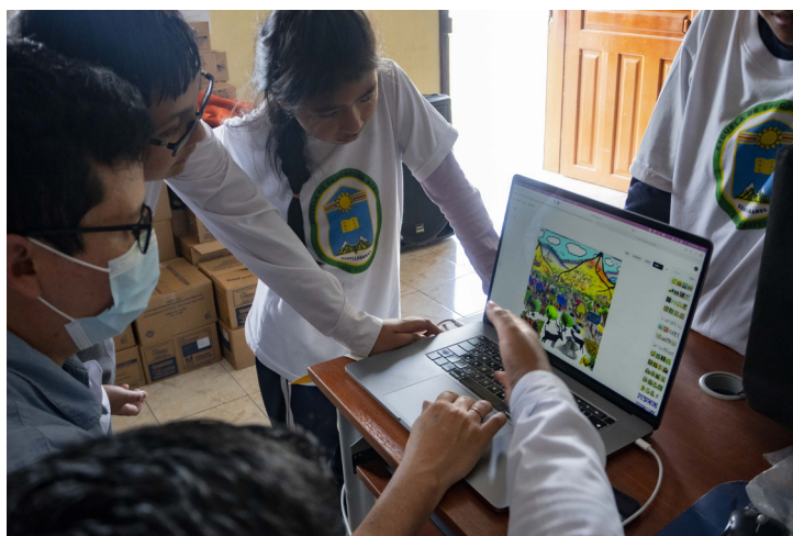
El uso de la tecnología también refuerza la experiencia de aprendizaje, porque se adapta a los objetivos de las actividades desarrolladas.