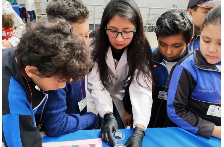
En el Museo Interactivo de Ciencia la práctica es esencial con estudiantes, para generar una comprensión integral de los temas que se abordan.

Se explicó que la Educación Ambiental debe ser priorizada por territorios y necesidades estadísticas, lo cual la convierte en un proceso a largo plazo. «Es necesario aprovechar fortalezas que ya existen en el territorio y tomar en cuenta y empoderar a docentes, pues son quienes aterrizan lo aprendido», se comentó. Se agregó que se debe trabajar con los gobiernos autónomos descentralizados (GAD) en función de su realidad y apoyar la creación de alianzas públicas y privadas puesto que pueden generar mayor impacto y sostenibilidad.