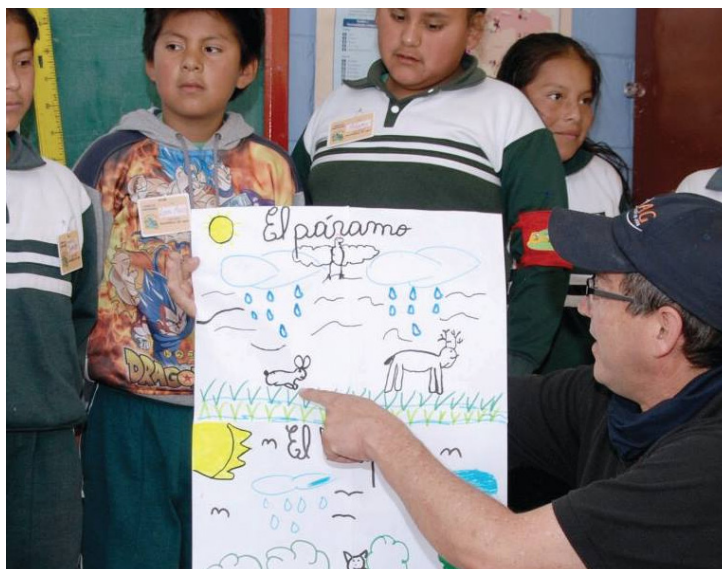
Los recursos didácticos tradicionales no pierden vigencia porque son un recurso eficiente como elemento de expresión de los participantes.

En cuanto a las barreras para implementar iniciativas, se comentó que la gente ya no aprende de la misma forma. Se explicó que antes se priorizaba la educación a través de libros y que ahora existen dispositivos, como los celulares, que tienen información mucho más amplia y se manejan de manera distinta. Se destacó que otra barrera es que son contados los casos en los que los profesores y las profesoras conectan a los y las estudiantes con actividades prácticas. Se añadió que, en el sector público, la Educación Ambiental está relegada y no se le da la relevancia oportuna. Ante esto, se sugirió analizar los contextos familiares y comunitarios y aplicar un enfoque holístico e integral puesto que hay una desconexión con la realidad local. Se enfatizó en que se deben repensar los currículos e integrar innovación y tecnología en los casos que sea posible.