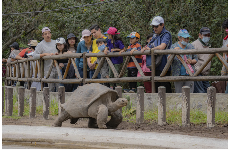
Mientras contemplan a los animales, los visitantes pueden reflexionar acerca de lo que zoológico significa en su proceso de rehabilitación después de ser rescatados.

Ante las potenciales quejas de los y las visitantes sobre el encierro que viven los animales en los zoológicos, se comentó que se debe explicar que un zoológico no es un circo. Es necesario educar a la ciudadanía respecto a cómo las acciones individuales y sus consecuencias provocan que los animales no puedan volver a su medioambiente. Se concluyó que estas fallas de percepción surgen porque no se hace la conexión del zoológico con los problemas que enfrenta la sociedad. Por ejemplo, es esencial comentar que en un mundo ideal no debería haber zoológicos, pero que el tráfico de especies los hace inevitables.