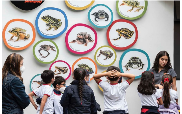
Visita a Wikiri Sapoparque por instituciones educativas.

Se determinó que espacios como los zoológicos, los jardines botánicos y los museos de ciencia no son apolíticos y que deben ser parte de la educación y también de la discusión. Se habló sobre la necesidad de abrir espacios para más voces.