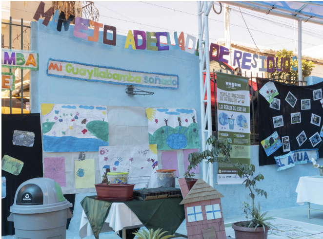
Niños y niñas de la Escuela República de Colombia de Guayllabamba hicieron una exposición sobre el correcto uso de desechos, en un evento del proyecto Waylla del Zoológico de Quito.