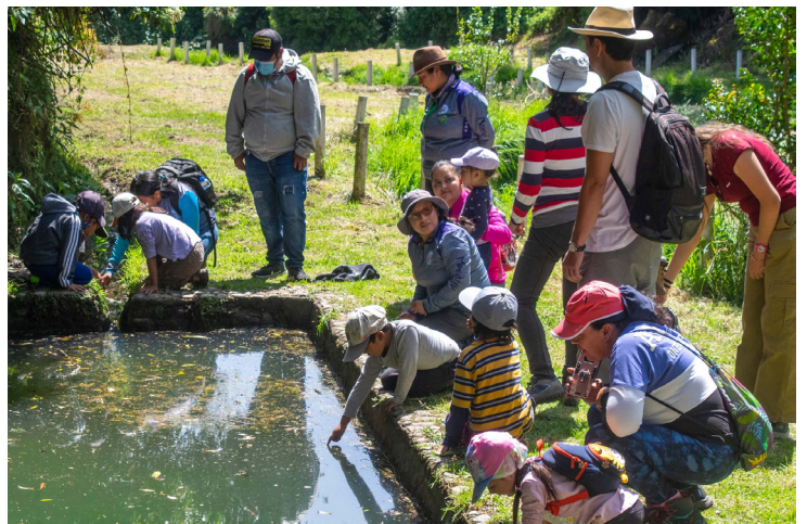
Actividades de ciencia ciudadana son fundamentales para crear conciencia comunitaria respecto a los efectos de un manejo de desechos.

Sobre los sistemas Basura Cero, se determinó que existen diferentes perspectivas relacionadas con un estilo de vida consciente para evitar generar residuos, la disminución del porcentaje de residuos orgánicos e inorgánicos, la búsqueda de darles una segunda vida a los productos y el consumo responsable. Se indicó que lo recomendable para lograr un sistema Basura Cero es desarrollar un plan integral de gestión que involucre estrategias de gestión, educación, vinculación, comunicación y reducción de consumo. Sin embargo, se aclaró que, si se toman como referencia los sistemas de países desarrollados, como Países Bajos, se debe considerar que tampoco son óptimos porque el consumismo sigue siendo una problemática significativa.