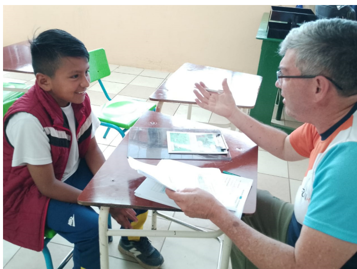
El método de entrevistas facilita la obtención de indicios concretos para una investigación fructífera.

Otro aspecto destacado fue la pertinencia de mantener las acciones en el tiempo para poder medir su impacto a largo plazo, sistematizar la información y socializarla. También se resaltó la importancia de tener claridad respecto al público objetivo cuando se seleccionan las herramientas para realizar la evaluación.