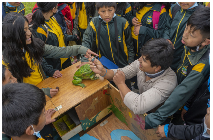
La maleta de ranas es una herramienta didáctica innovadora del Zoológico de Quito, que fomenta una activa participación de estudiantes de todas las edades.