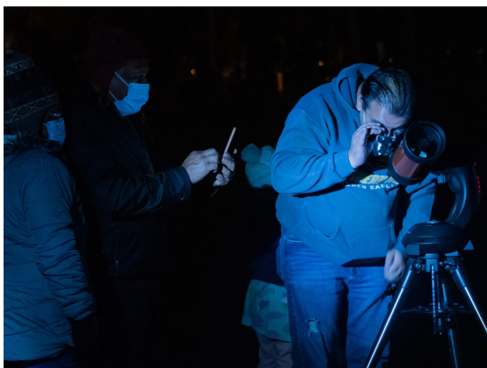
Veladas astronómicas realizadas en el MIC (Museo interactivo de ciencia) organizadas por la Red Divulgación.

Se concluyó que los zoológicos, los jardines botánicos y los museos de ciencia deben ser espacios que permitan generar experiencias de aprendizajes experimentales. Tienen que convertirse en los ambientes ideales para hablar de ciencia y enamorar a los y las visitantes de la naturaleza y despertar su curiosidad. Se destacó que crear estas experiencias es un reto educativo. Se indicó que el aprendizaje debe ser concreto para que la comunicación no se limite a la transmisión de información que puede ser fácilmente olvidada. Los datos que se comparten tienen que ser comprensibles y permitir que se pase de lo técnico a lo práctico. Se resaltó que, al no estar atados a una malla curricular de educación formal, estos espacios tienen la ventaja de que pueden adaptar los procesos de aprendizaje. Sin embargo, por este mismo hecho, es complicado realizar un seguimiento del impacto logrado pues la parte vivencial es difícil de medir.