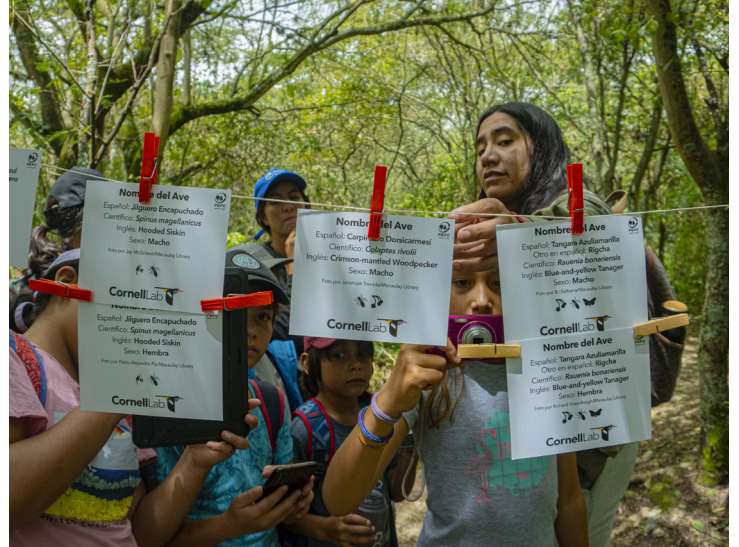
Los recursos didácticos y participativos son esenciales en actividades como el Desafío Naturaleza Urbana, donde también existe contacto con la naturaleza.

Respecto a las barreras que enfrenta la divulgación científica, se reflexionó sobre la importancia que tiene en los procesos educativos. Los y las participantes consideraron que en Ecuador todavía no existe una cultura y una práctica de divulgación científica en ningún ámbito de la educación, ya que es una actividad que se realiza de forma autónoma y voluntaria desde algunos grupos científicos, redes o, simplemente, a través de profesionales independientes.