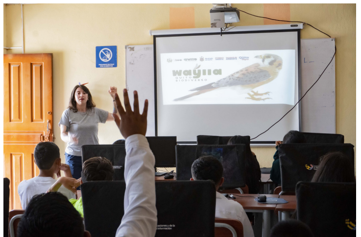
La vinculación con la comunidad es un factor clave para las instituciones que promueven educación ambiental, donde no falta emotividad por la sintonía que establecen los diferentes actores.

Se agregó que la capacitación es clave y que el aprendizaje debe estar basado en proyectos. Se recordó que es necesario identificar las falencias de la educación, empezando por un diagnóstico hacia los y las docentes y tomando en cuenta que son procesos largos en los que no se puede garantizar la sostenibilidad. Se remarcó que la Educación Ambiental no debe limitarse al aula, pues tiene que ser vivencial, experimental e in situ. En este tema, se lamentó que la planificación de clases se haya convertido en una actividad mecánica en la que no hay una relación entre los datos que permita que la información sea práctica y útil. Se añadió que en la ruralidad además existe una brecha tecnológica.