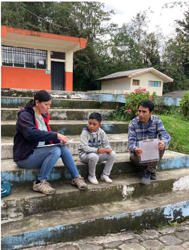
El FONAG basa su trabajo de educación ambiental mediante entrevistas con la comunidad

Adicionalmente, se manifestó la falta de conocimientos y experiencia en pedagogía por parte de algunos educadores y educadoras ambientales debido a que generalmente tienen un bagaje ambiental y a la falta de oferta educativa universitaria en la materia. Esto se traduce en que las experiencias no sean suficientemente significativas (no solamente una transmisión de conocimientos o información), lo que, aunado a las falencias en evaluación, hace que no se visibilicen adecuadamente los resultados obtenidos.