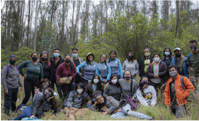
Reconectar con la naturaleza fue una de las principales motivaciones para el tercer encuentro.