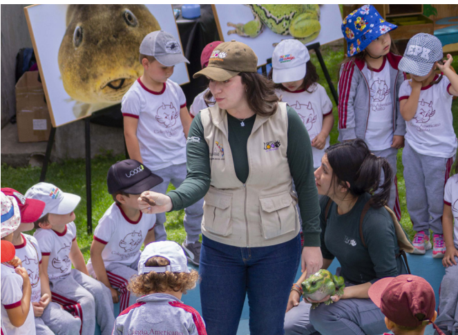
"El Zoo va a tu Escuela" es una acción que despierta la sensibilidad de niños y niñas por la fauna silvestre, desde su espacio cotidiano de formación.

Además, se habló de la desarticulación entre las acciones en Educación Ambiental del Ministerio de Educación y el Ministerio del Ambiente, Agua y Transición Ecológica. Se denotan dobles esfuerzos y no hay una rectoría clara o trabajo conjunto sobre el tema, lo que debilita el cumplimiento de los objetivos deseados. Se indicó que no existe seguimiento sobre el uso de metodologías pedagógicas y material didáctico.