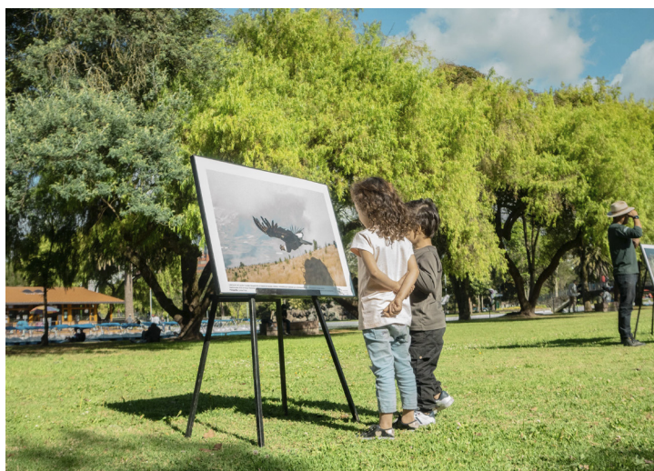
En la exposición fotográfica de "Música por el Cóndor", dos niños se enteran cómo fue liberado el cóndor Gualabi, un ave que se rehabilitó en el Zoológico de Quito.