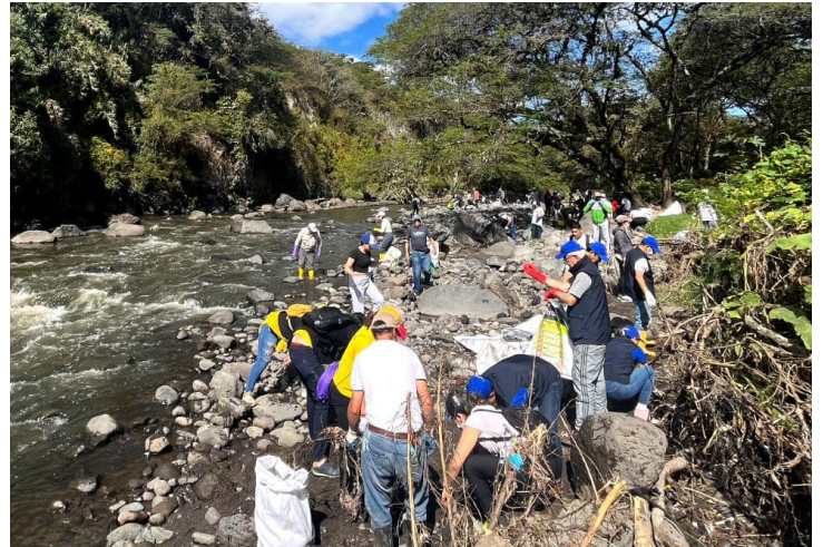
El colectivo de Rescate del Río San Pedro desarrolla acciones comunitarias frecuentes, para mitigar la contaminación en ese afluente de la ciudad.

Se mencionó la necesidad de cambiar la lógica de cómo se relacionan los seres humanos con los residuos. «Es importante aprender a decir que no a lo que no necesitamos para reducir la producción de desechos», se comentó. Respecto al compostaje, por ejemplo, se lo definió como una alternativa «esperanzadora» pues es un elemento de conexión con la naturaleza.