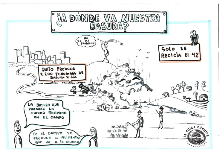
Ilustración facilitada por La Guica Cósmica, colectivo que promueve una gestión responsable de desechos en la Quito.

Se comentó que en este problema influyen la resistencia al cambio y el desconocimiento, además de la falta de conciencia sobre la reducción del consumo. «Existe difusión de lo que debemos hacer con los desechos como generadores de los mismos, pero no lo ponemos en práctica». Se destacó que el tema de los residuos se percibe como algo lejano porque la basura «se esconde». En este sentido, se agregó que la Educación Ambiental, para abarcar la problemática actual, no debe enfocarse solo en la separación de residuos, sino también en aspectos como la reducción del consumo.