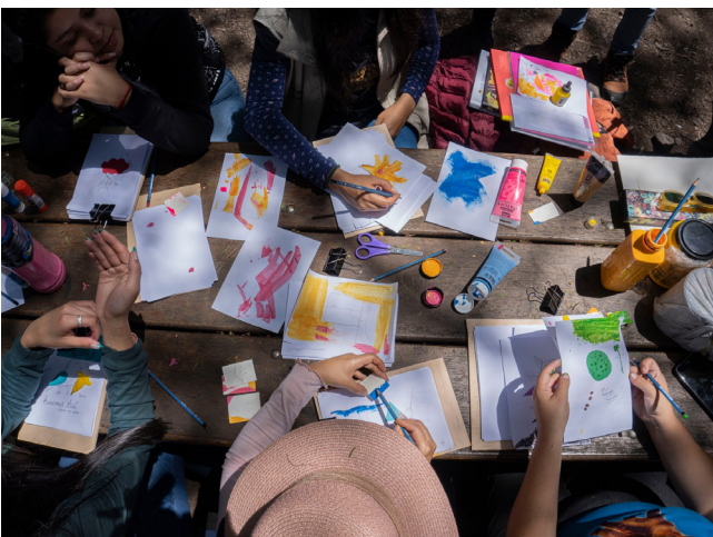
El arte nos conecta con la naturaleza mediante un vínculo establecido desde nuestra creatividad.