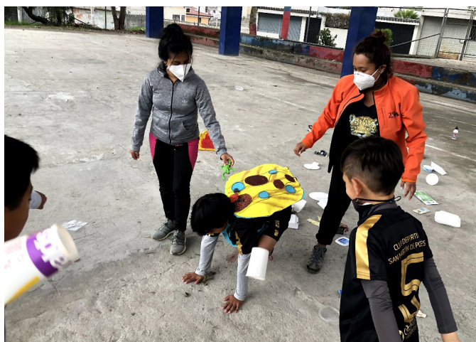
Los niños y niñas asumen un rol importante en los procesos de educación ambiental, apropiándose de su responsabilidad de ser ciudadanos más responsables con la naturaleza.

Sobre cuál es el papel de la Educación Ambiental en relación con la problemática que se vive en Quito y sus residuos, se señaló que es el eje fundamental ya que es indispensable para concientizar sobre el problema. Se destacó que, mientras exista un aumento sostenido de conciencia ambiental en la sociedad, es más probable tener una disminución de la producción de residuos y un mayor aprovechamiento de estos. Respecto a la educación, se estableció que debe ser una educación que no castigue, pero que sí incentive las buenas prácticas. Se planteó que la educación debe ser una estrategia participativa, una educación para la sustentabilidad, que permita entender cómo se vive en cada hábitat y cómo cada individuo se debe relacionar responsablemente con este.