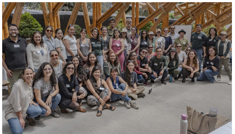
En la quinta edición del EA26 Ecuador contamos con la presencia de representantes de instituciones que fomentan acciones de conservación y educación ambiental.

El 26 de enero es un día dedicado a reflexionar sobre el papel de la Educación Ambiental. Por ello, el Zoológico de Quito organiza desde hace cinco años el Día Mundial de la Educación Ambiental (EA26 Ecuador) como un espacio formativo y de diálogo entre profesionales vinculados con la educación, el ambiente y la conservación. El objetivo es contribuir con el desarrollo de procesos educativos que incentiven la conservación ambiental desde la acción ciudadana.